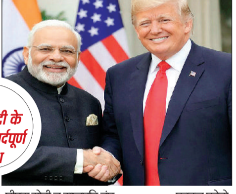
पीएम मोदी व राष्ट्रपति ट्रंप फाइल फोटो

भारत और अमेरिका के बीच नए व्यापारिक युग की शुरुआत हो चुकी है। सोमवार (02 फरवरी) को राष्ट्रपति डोनाल्ड ट्रंप ने भारत पर लगाया पारस्परिक टैरिफ 18 फीसदी कर दिया। इसी के साथ लंबे समय से अटके व्यापार समझौते पर भी ट्रंप ने सहमति जताई है। ऐसे में अब व्हाइट हाउस की प्रेस सचिव कैरोलिन लेविट ने भारत-अमेरिका के व्यापार समझौते पर जानकारी साझा की है। उन्होंने दावा किया कि पीएम मोदी ने अमेरिकी अर्थव्यवस्था में बड़े निवेश का वादा किया है। प्रेस सचिव कैरोलिन लेविट ने बुधवार को अमेरिका-भारत समझौते, अमेरिकी राष्ट्रपति डोनाल्ड ट्रंप और पीएम नरेंद्र मोदी के बीच सौहार्दपूर्ण संबंधों का जिक्र किया। लेविट ने दावा किया कि पीएम मोदी रूसी तेल की खरीद बंद करने और इसके बजाय अमेरिका और संभवतः वेनेजुएला से तेल खरीदने पर सहमत हो गए।