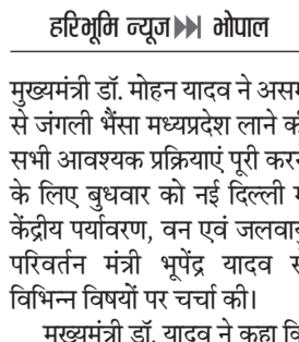
मंत्रियों के बीच मजबूत संबंध

विदेश मंत्री डॉ. जयशंकर ने अपनी एकस पोरस्ट में अमेरिकी विदेश मंत्री से हुई मुलाकात को लेकर प्रसन्नता जताते हुए कहा कि हमारे बीच व्यापक चर्चा हुई है। जिसमें दोनों देशों के द्विपक्षीय सहयोग के एजेंडे, क्षेत्रीय और अंतरराष्ट्रीय मुद्दों को शामिल किया गया। साथ ही भारत और अमेरिका राजनीतिक साझेदारी से संबंधित तमाम पहलुओं जैसे व्यापार, ऊर्जा, परमाणु, रक्षा, महत्वपूर्ण खनिज और प्रौद्योगिकी पर भी चर्चा