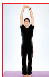
हो, वे इस आसन को न करें।