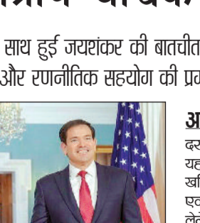
दोनों देशों के बीच मजबूत संबंध