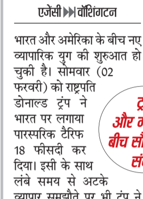
►► वॉशिंगटन

कैरोलिन लेविट ने कहा कि भारत ने न सिर्फ रूस से तेल खरीदना बंद करने की प्रतिबद्धता जताई है, बल्कि अमेरिका से तेल खरीदने की भी प्रतिबद्धता जताई है, और संभवतः वेनेजुएला से भी, जिसका सीधा लाभ अब अमेरिका और अमेरिकी जनता को मिलेगा