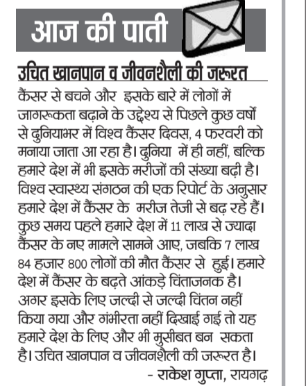
लेख पर अपनी प्रतिक्रिया haribhoomi@gmail.com पर दे सकते हैं।